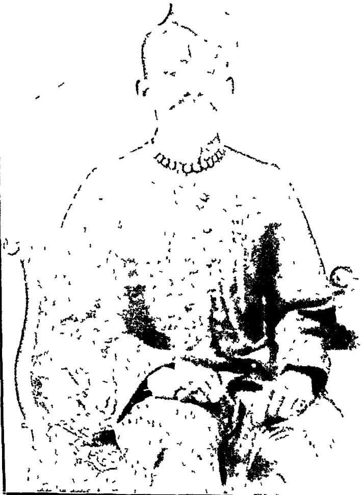
सेठ गोविन्ददास अवस्था २४ वर्ष, सन् १६२०